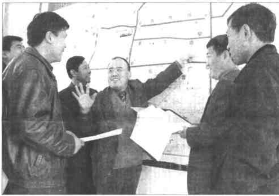
东营公路分局认真做好辖区干线公路养护工作。为了搞好公路的养护，近日他们又制作了公路养护专用地图，使辖区公路图标一目了然，加快了公路养护的调度，使公路养护水平上了一个新台阶。图为该局负责人员在研究公路养护工作。