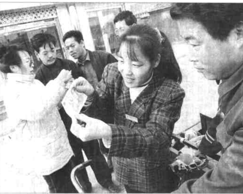
广饶县大营农村信用社下乡为农民发放贷款的有利时机,加大对假币知识的宣传,使群众提高对假币的识别能力,共发放各类宣传材料5000余份,从而使群众避免了一些不必要的经济损失,深受群众的欢迎。

他们还实施了“心连心”帮贫致富工程,每名机关干部和农村党员干部都选择1至2名贫困户签定协议书,结成党群、干群致富联合体,与群众交朋友,心连心。从资金、技术、项目、信息、劳务等方面提供帮助,共结成帮贫致富联合体144对,使被帮户尽快脱贫致富。(张明华)